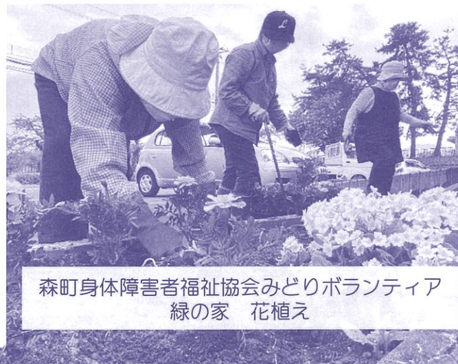
森町身体障害者福祉協会みどりボランティア 緑の家 花植え