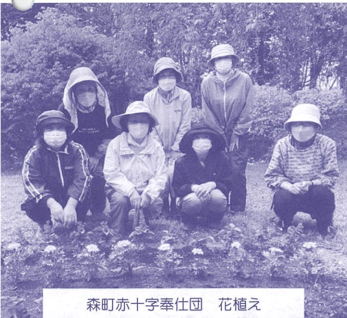
森町赤十字奉仕団 花植え