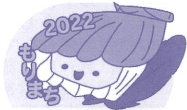
イメージキャラクター 「ホタッテーちゃん」