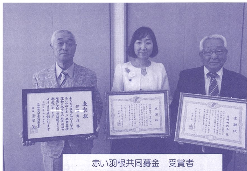
赤い羽根共同募金 受賞者