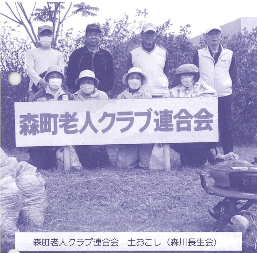
森町老人クラブ連合会 土おこし (森川長生会)