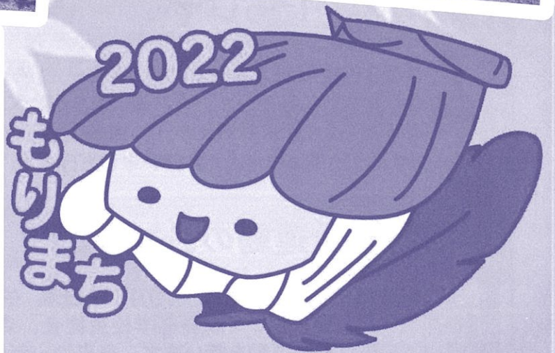
イメージキャラクター 「ホタッテちゃん」