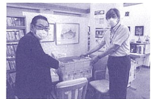
(第一生命森オフィス様)